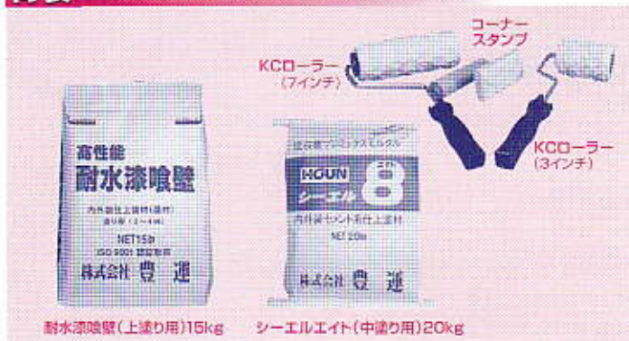
耐水漆喰壁(上塗り用)15kg